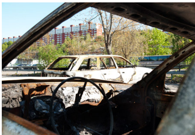
Två av de utbrända bilarna i Norsborg.